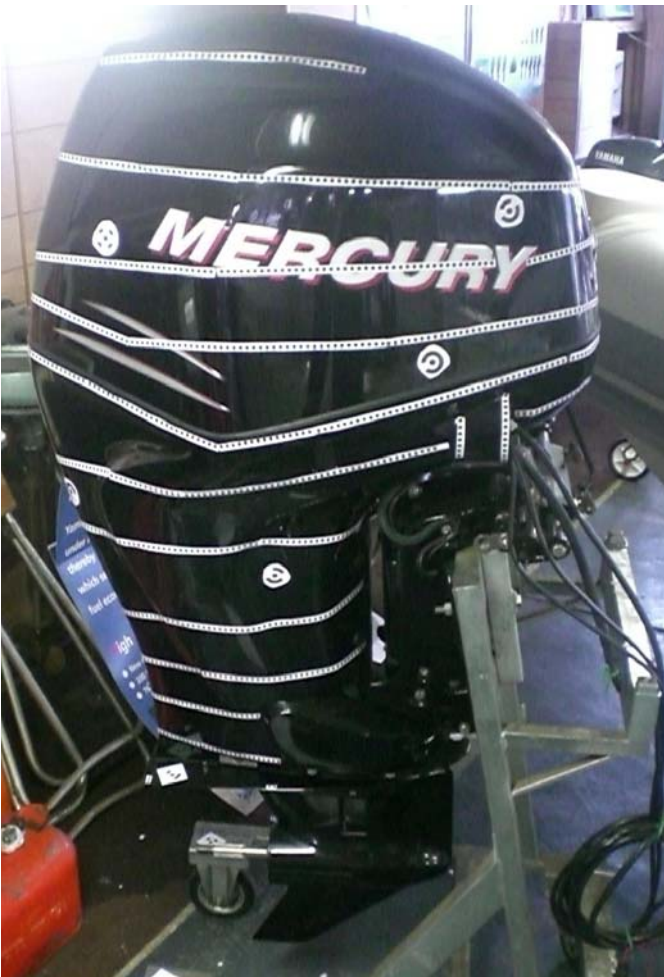
Immagine del motore durante il rilievo

Tecnica di rilievo fotogrammetria close range